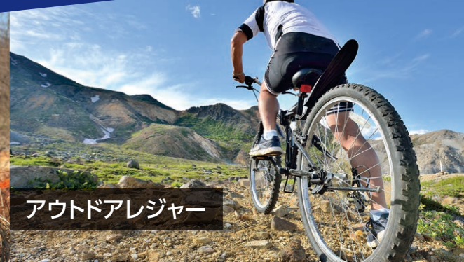
アウトドアレジャー