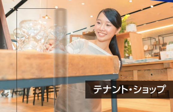
テナント・ショップ