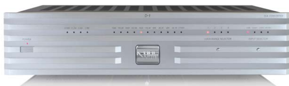
D-1 (プラチナム・シルバー)