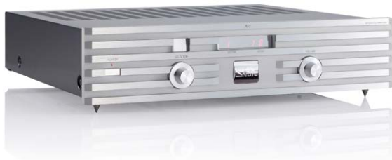
A-1 (プラチナム・シルバー)